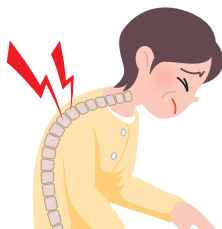
せほね 背骨の骨折