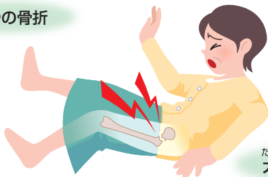
だいたいこつ 大腿骨の骨折